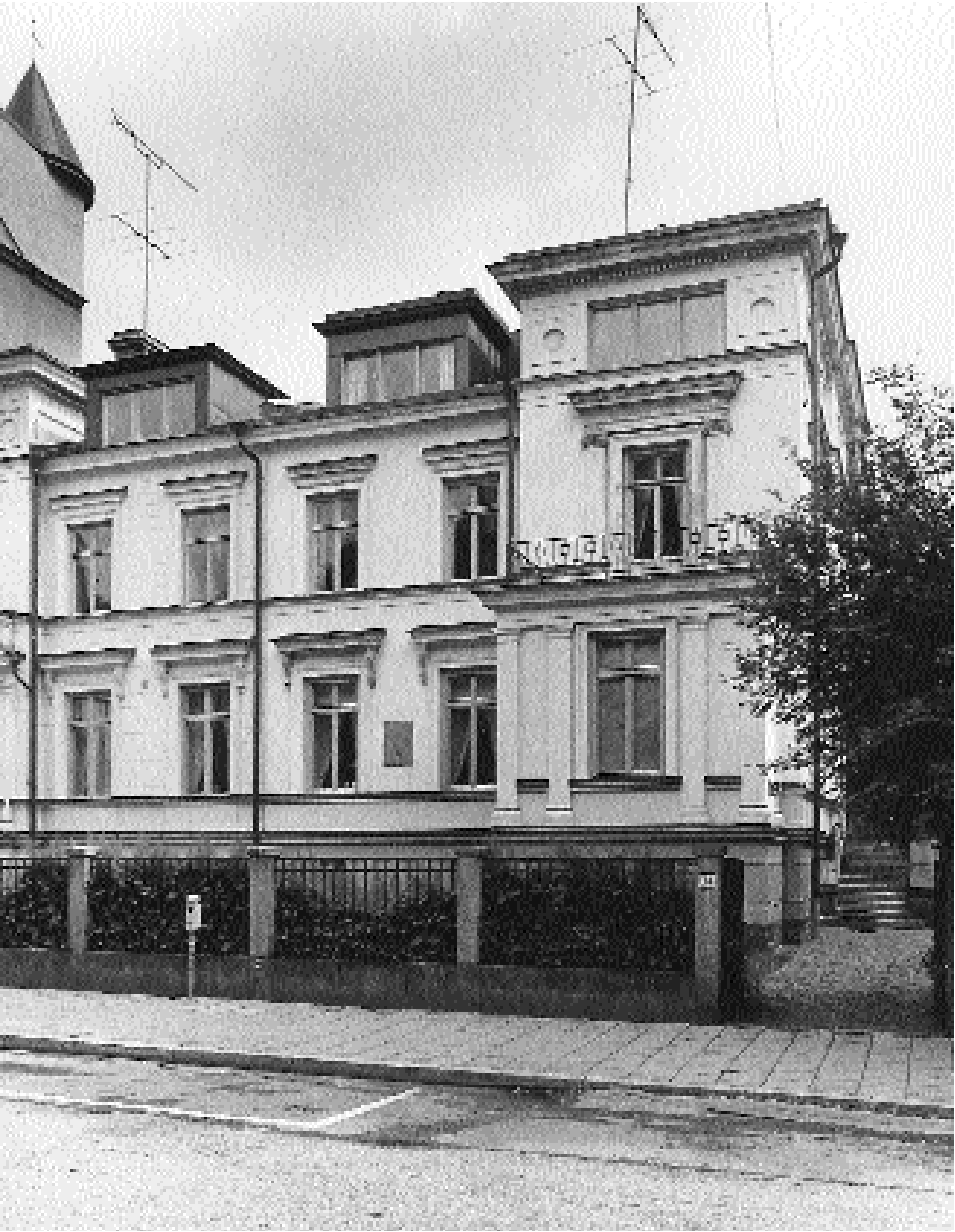
Lotten von Kræmers hus på Villagatan 14 på Östermalm i Stockholm där Samfundet De Nio fortfarande håller sina sammankomster.